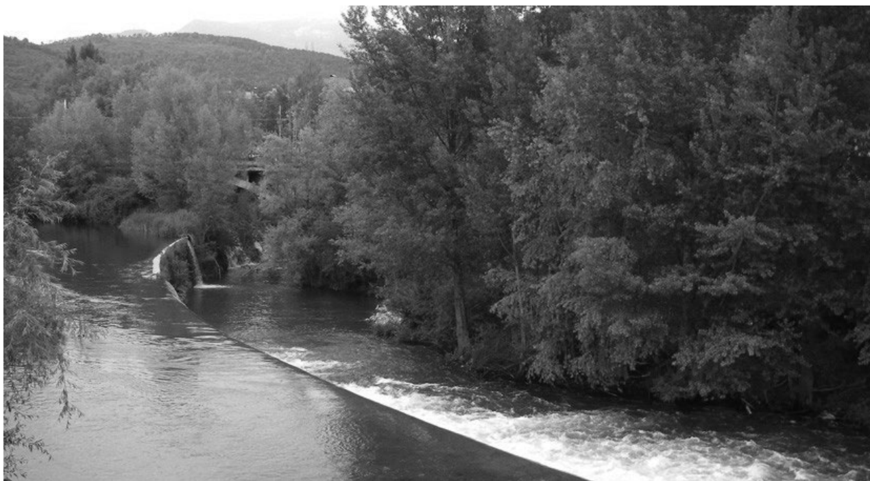
Figura 2. Hidroeléctrica en desuso en el río Ter.

Para la implementación de este proyecto, se contó con la participación activa de la propia comunidad, quienes se formaron y participaron en la construcción del sistema. Además, se incluyeron formaciones relacionadas con cambio climático, conservación de recursos naturales, así como gestión y mantenimiento de sistemas hidroeléctricos.